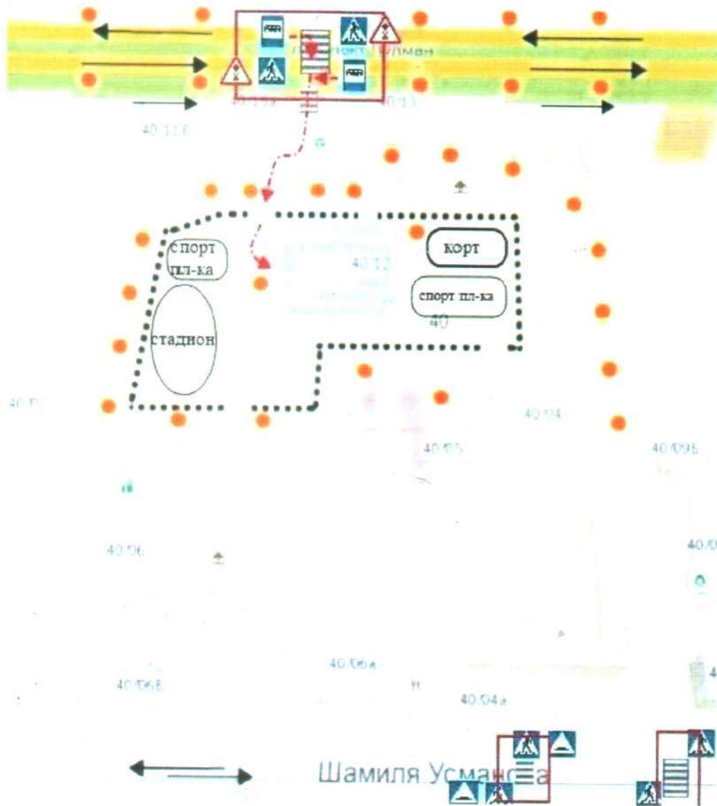
Схема организации дорожного движения в непосредственной близости от образовательного учреждения с размещением соответствующих технических средств организации дорожного движения, маршрутов движения детей и расположения парковочных мест